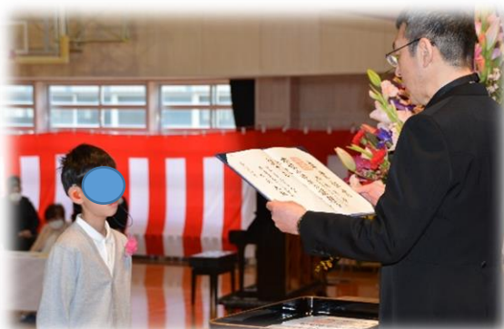
校長先生から卒業生一人一人に卒業証書が授与されました