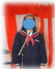
在校生を代表して感謝の言葉を伝えました