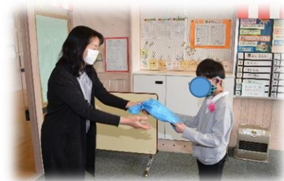
P T Aを代表して副会長から卒業生に記念品が贈られました