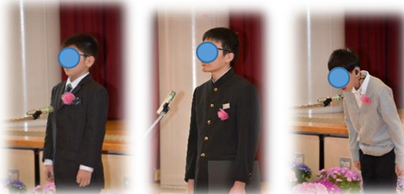
卒業の詩～3人の思いを込めて