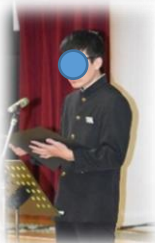
前田実行委員長、校長先生の挨拶