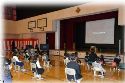
司会のBさん、はじめと終わりの言葉のCさん

本日、八戸盲学校は創立130周年を迎えました。僕は、この節目の年に、この学校の生徒の一員としていただけること、今日この日を皆さんと一緒に祝いできることを誇りに思います。この学校のいい所は、児童生徒の人数は少ないけれど、みんな仲が良いことです。また、今年は感染予防のために行われなかったけれど、運動会や遊ぼうDAYなど色々な活動を聾学校の皆さんと一緒にできるのも魅力の一つです。130年という長い歳月を想像することは難しいけれど、多くの先輩方とここに居る僕たちは、この八戸盲学校で学び、笑い、時には泣いたり怒ったりしながら、沢山の思い出とともに130年という時を歩んできました。この歴史ある素晴らしい八戸盲学校で私たちを支えてくれている人たちへの感謝の気持ちを忘れず、充実した学校生活を送り、新しい歴史を作っていきましょう。これからもよろしくお願いします。